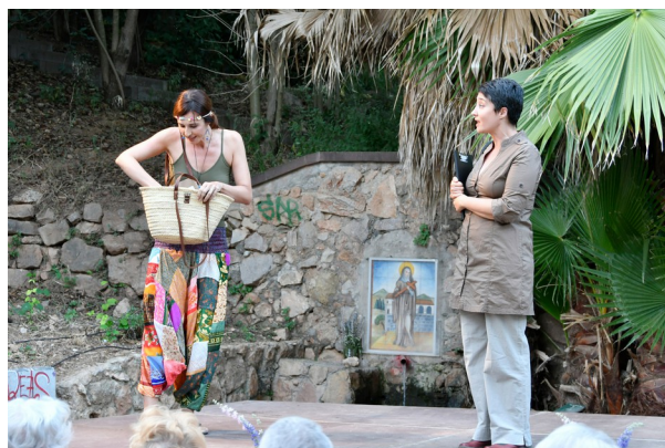
Foto de l'estrena de l'obra al festival "La cultura va a la font", a la Palma de Cervelló, el 14 de juliol de 2018.

Aquest muntatge és molt senzill en quant a necessitats tècniques. No cal il·luminació especial ni so (excepte si es fa a l'exterior, que sí que seria recomanable algun tipus de microfonia inalàmbrica, de la qual no disposa la companyia).